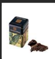
Chocolate a la taza Amatller